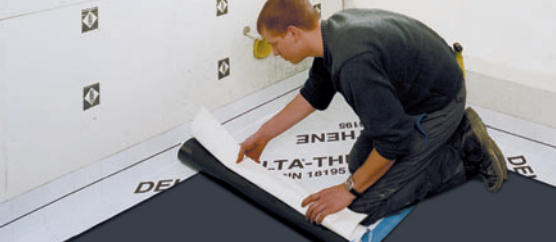
Rychlá pokládka izolace v roli.