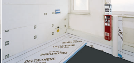
Bezpečná izolace v mokrých provozech.