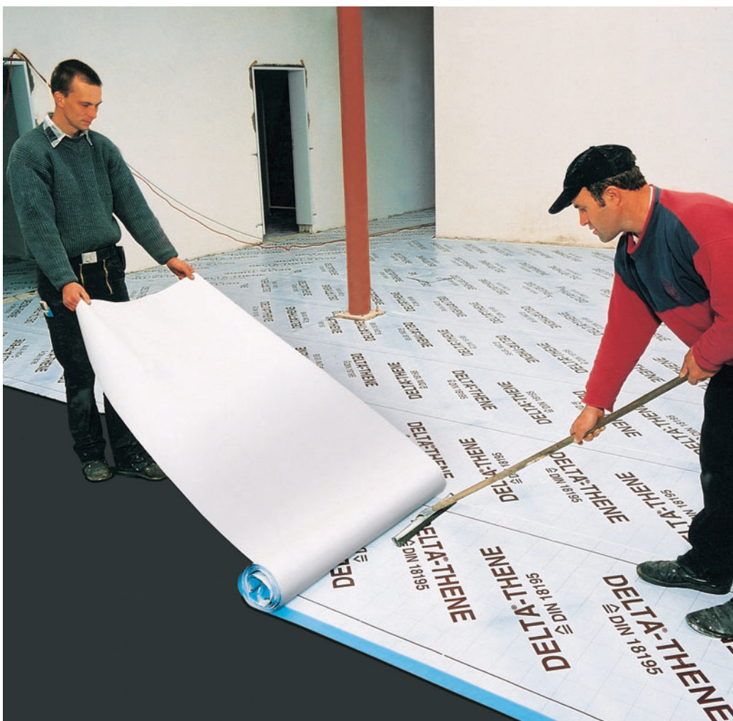
Velké plochy se s DELTA®-THENE izolují velmi jednoduše a bez nerovností.