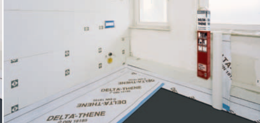
Biztonságos szigetelés a nedves helyiségekben.