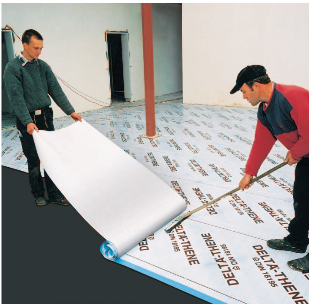
A DELTA®-THENE-vel a nagy felületek is egyenletes vastagságú szigeteléssel láthatóak el, egész egyszerűen.