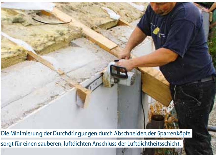
Die Minimierung der Durchdringungen durch Abschneiden der Sparrenköpfe sorgt für einen sauberen, luftdichten Anschluss der Luftdichtheitsschicht.

widmet sich der Detailplanung und Ausführung von Dachflächen. Es werden verschiedene Ausführungsmöglichkeiten der Luftdichtheitsschicht und deren Vor- und Nachteile beschrieben. So kann mithilfe des Merkblatts und unter Berücksichtigung der objektspezifischen Gegebenheiten ein in sich schlüssiges Luftdichtheitskonzept inklusive der Detailausbildungen erarbeitet werden. Unterschieden werden dabei Verlegungen der Luftdichtheitsschicht von der Rauminnenseite her (neubauähnliche Voraussetzungen), schlaufenförmige Verlegungen von außen, wannenförmige Verlegungen von außen und flächige Verlegungen von außen, zum Beispiel bei zusätzlicher Überdämmung. Als „Sonderfall“ wird auf den Versprung der Luftdichtheitsschichten eingegangen, der wegen seines hohen Fugenanteils und weiterer Unwäg-